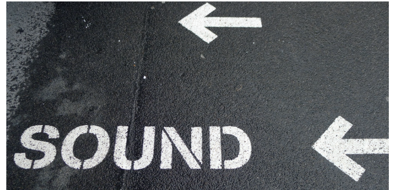
Da spielt die Musik! Mit einer unkonventionellen Nutzung ist Leben in die Steigmühle zurückgekehrt.

kämpft wegen des Konkurrenzdrucks aus dem Ausland ums Überleben. Indem wir nun eine alternative Strategie fahren und einen Mix aus Büros und Musik anstreben, ergibt sich eine Durchmischung – und das ist auch gut so: Ein reines «Musiker-Ghetto» wäre wohl zu einseitig gewesen.