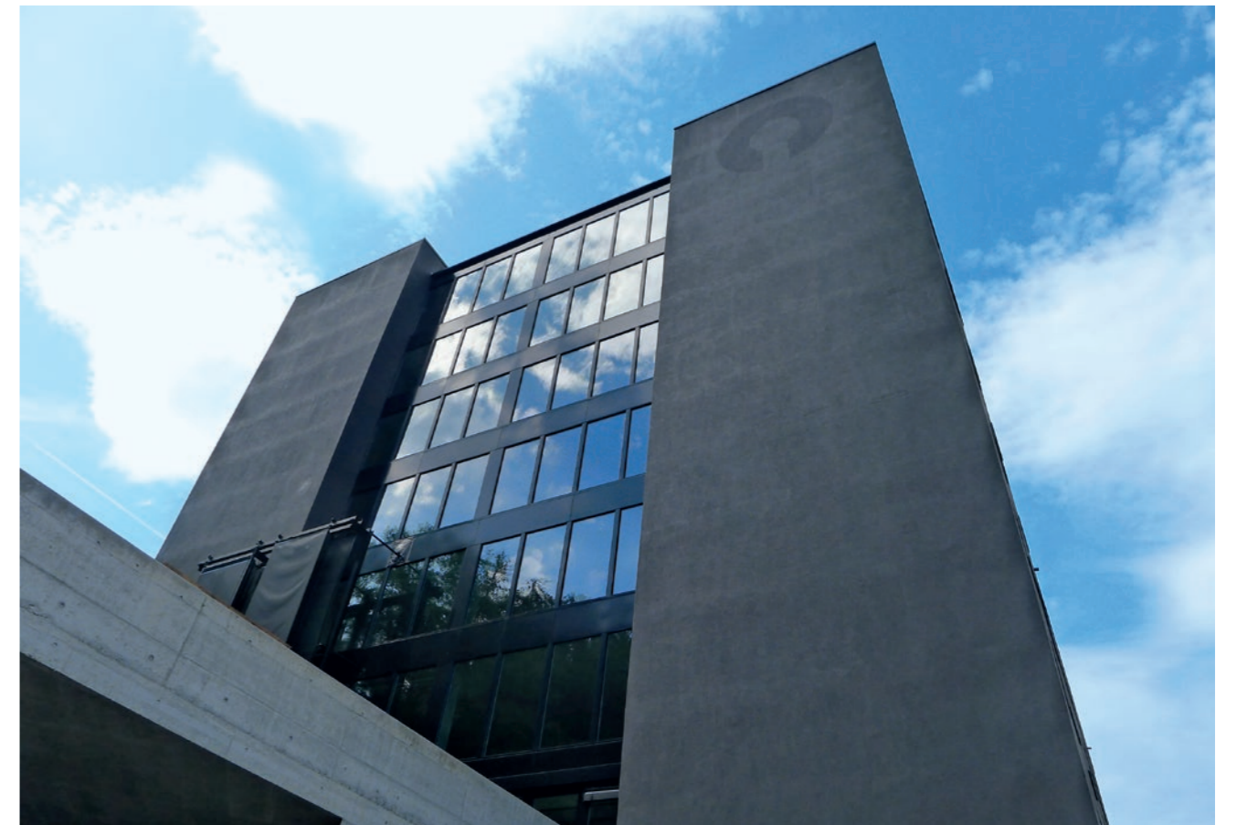
Anthrazitfarben und monolithisch: Die umgebaute Steigmühle macht als Claudia – House of Sounds einen guten Eindruck.

Zweifellos haben die 49 Bandproberäume die Wahrnehmung des Claudia – House of Sounds in der Öffentlichkeit geprägt,