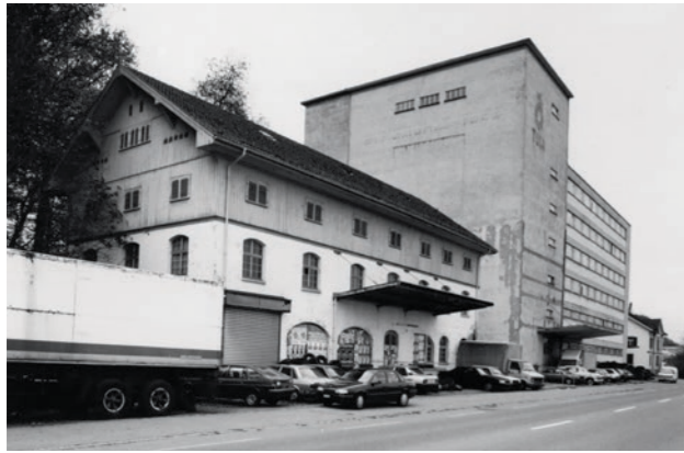
Steigmühle, 1999.