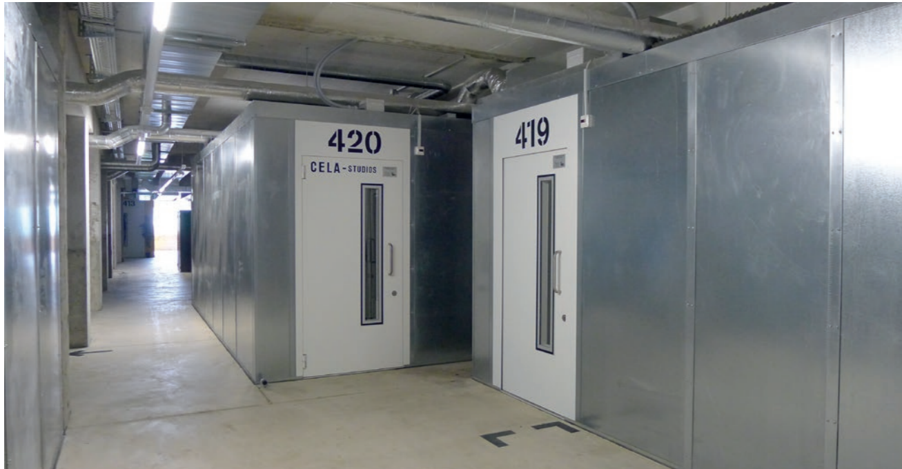
Nichts zu hören: Die Proberäume sind in einzelnen, schallsolierten Containern untergebracht – damit wurden alle Lärmprobleme elegant gelöst.

aber neben dem Restaurant und dem Club sind in dem Gebäude auch viele Büros, Gewerbebetriebe wie eine Weinhandlung und ein Modellbaufachmarkt, ein Bauchtanzlokal (zum Zuschauen) und ein Fitnessstudio (zum Mitmachen) untergebracht. Ein Auto-Oldtimer-Händler, ein Baugeschäft und Lagerräume runden den Mietermix ab. Die Nutzung des sechsten Stocks – eines über 700 m 2 grossen Raums mit grosszügiger Verglasung und umlaufender Terrasse – ist derzeit noch offen. Das heisst: Er wäre noch zu haben ... inklusive grossflächiger, dekorativer Graffiti an den Wänden und Krähen-Fussabdrücken auf dem Betonboden, die noch aus der Zeit des Leerstands stammen.