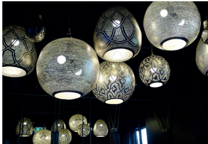
«Oriental industry chic»: Orient mischt sich mit Neuzeit.

Und der wird auch in Töss celebriert, denn im Lokal sind sechs Tische mit einem integrierten Grill ausgestattet, an dem die Gäste ihre Speisen selber zubereiten. Das Konzept ist übrigens auch für Vegetarier attraktiv: Denn in der Türkei wird