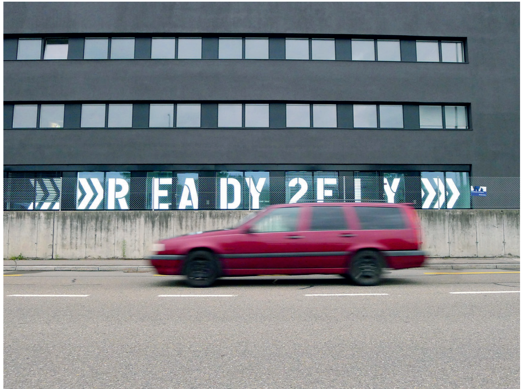
Oben wird gerockt, unten geflogen: Der Modellbauladen «ready 2 fly» ist einer

Die alte Zürcherstrasse, die Autobahn und die Bahnlinie auf der Ostseite des Gebäudes lassen nicht gerade bukolische Idylle aufkommen – dafür ist der Bau verkehrstechnisch sehr gut angebunden und auch seine Werbewirkung in eigener Sache darf nicht unterschätzt werden. «Die Nachfrage ist gut, die Bandproberäume gingen ja sofort weg und auch die rückwärtigen Büros sind wegen ihres Ausblicks ins Grüne sehr begehrt», sagt Caroline Petritsch. «Aber auch zur Autobahn hin ist schon vieles vermietet: Der Verkehr ist hier nicht wirklich ein Problem – die Isolierverglasung hält den Lärm ja weitestgehend ab.» Und gar kein Problem damit haben die Lokale, die ebenerdig an den Strassenraum angebunden sind. Im Gegenteil: Hier ist die optimale Anbindung sogar erwünscht. So wird zum Parkplatz auf der Westseite hin bald eine Weinhandlung eröffnet und an der Zürcherstrasse hat sich die Firma «ready 2 fly» eingemietet, die ferngesteuerte Modellflugzeuge sowie Zubehör anbietet. Und das Geschäft läuft gut: Immer wieder fahren Kunden vor – es scheint sich schnell herumgesprochen zu haben, dass Claudia auch ein «House of Flight» ist. Nebenan, in den Garageräumen, handelt Beat Flückiger mit Oldtimer- und Youngtimer-Autos. «Eben, es ist ein Männerhaus», kommentiert Caroline Petritsch noch einmal mit vielsagendem Lächeln. «Ein Nähatelier oder ein Nailstudio – das wäre hier jedenfalls schon etwas deplatziert.»